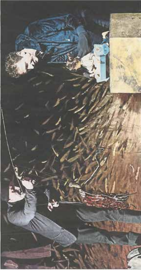
Ob das ein gutes Ende nimmt? „Rumpelstilzchen“ fordert von Müllerstochter Marie das erstgeborene Kind ein. Schließlich hat es reichlich Gold gesponnen, das hat seinen Preis. Das Stück, gespielt von Tomas Mielentz und Martin Vogel, hatte jetzt Premiere im Puppentheater Waidspiecher.

daher. Es fliegt und surrt wie ein Raumschiff und es leuchtet sogar ganz niedlich im Dunkeln. Erst später wächst das Märchen zu einschüchternder Größe heran, als es von Müllerstochter Marie das erstgeborene Kind einfordert für sein Werk, aus Stroh so reichlich Gold gesponnen zu haben, dass es überall nur so glänzt auf der Bühne des Waidspiechers. Dabei verschmelzen die Puppenspieler eng mit ihren Figuren